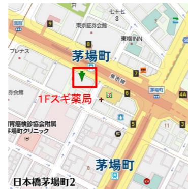
日比谷線・東西線 6番出口 徒歩1分 浅草線「日本橋駅」徒歩7分 銀座線「日本橋駅」徒歩8分 JR線「東京駅」徒歩20分