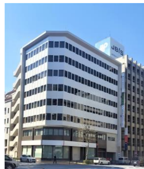
東京営業所 入居ビル 東京都中央区日本橋茅場町1-8-3 JP船茅場町ビル7階 (1Fスギ薬局)