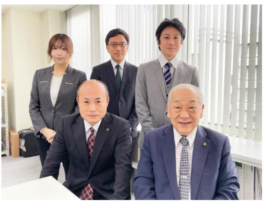
兜町の証券取引所を背景に